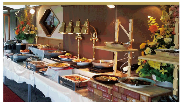
ビュッフェプラン