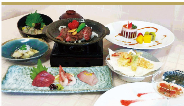
和洋折衷会席プラン